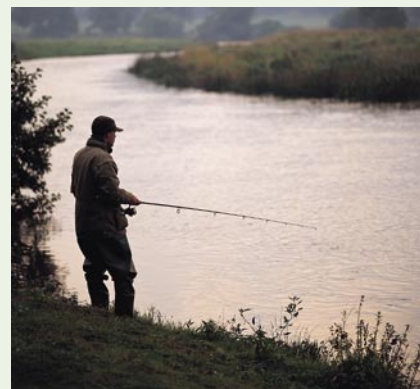
Loven skal sikre og genoprette både vandløb og de enge, de hører sammen med.

Statslige erhvervelser eller ekspropriation kan være den eneste farbare vej for at sikre et naturområde for eftertiden, sikre naturgenopretning eller sikre en god adgang for offentligheden. Derfor skal loven sikre, at der afsættes en tilpas beløbsramme på den årlige finanslov til disse formål.