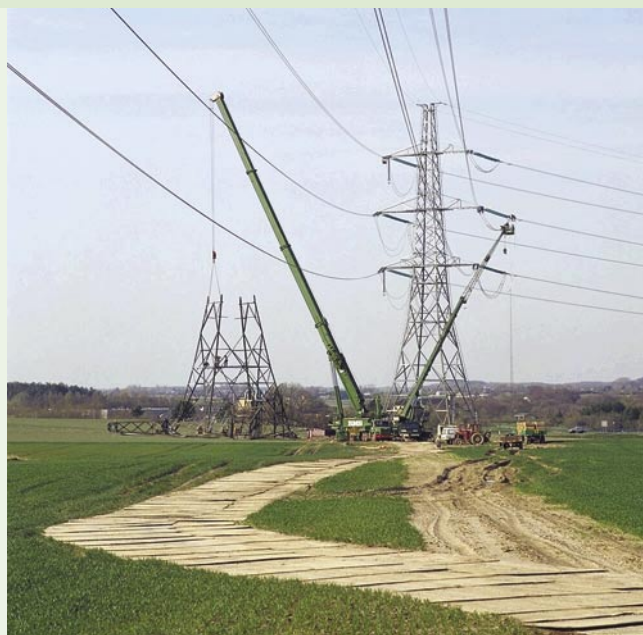
Loven skal beskytte mange flere værdifulde landskaber end i dag mod bl.a. master og vindmøller.

Bestemmelserne om, at der ikke må reklameres i det åbne land er svarende til den gældende lovs § 21, idet skove dog er tilføjet.