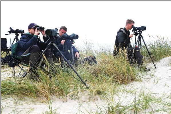
Observationer af trækfugle for Blåvand Fuglestation på Blåvandshuk.

De unges ophold på fuglestationerne udvikler sig stille og roligt i retning af en feltornitologisk uddannelse, hvor den enkelte frivillige ikke blot fokuserer på enten ringmærkning eller træktælling, men skal deltage i de forskellige dataindsamlings- og formidlingsaktiviteter, som fuglestationerne gennemfører. De fleste af de unge er glade for denne mulighed og synes, de får meget ud af det.