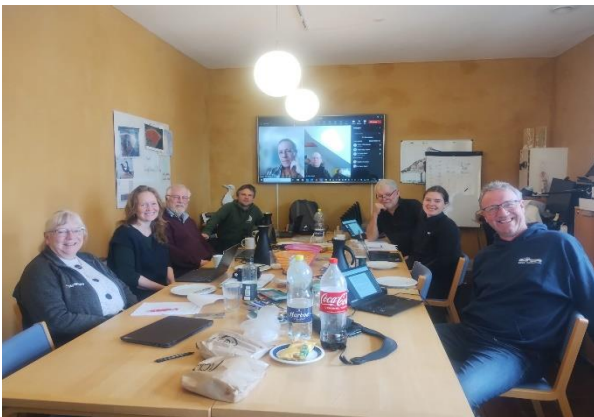
Udvalgsmøde på Skagen Fuglestation 13.-14. april 2024.

Tilsvarende kan informationer om de tre A-fuglestationers virke læses på Blåvand Fuglestation , Gedser Fuglestation og Skagen Fuglestation hjemmesider.