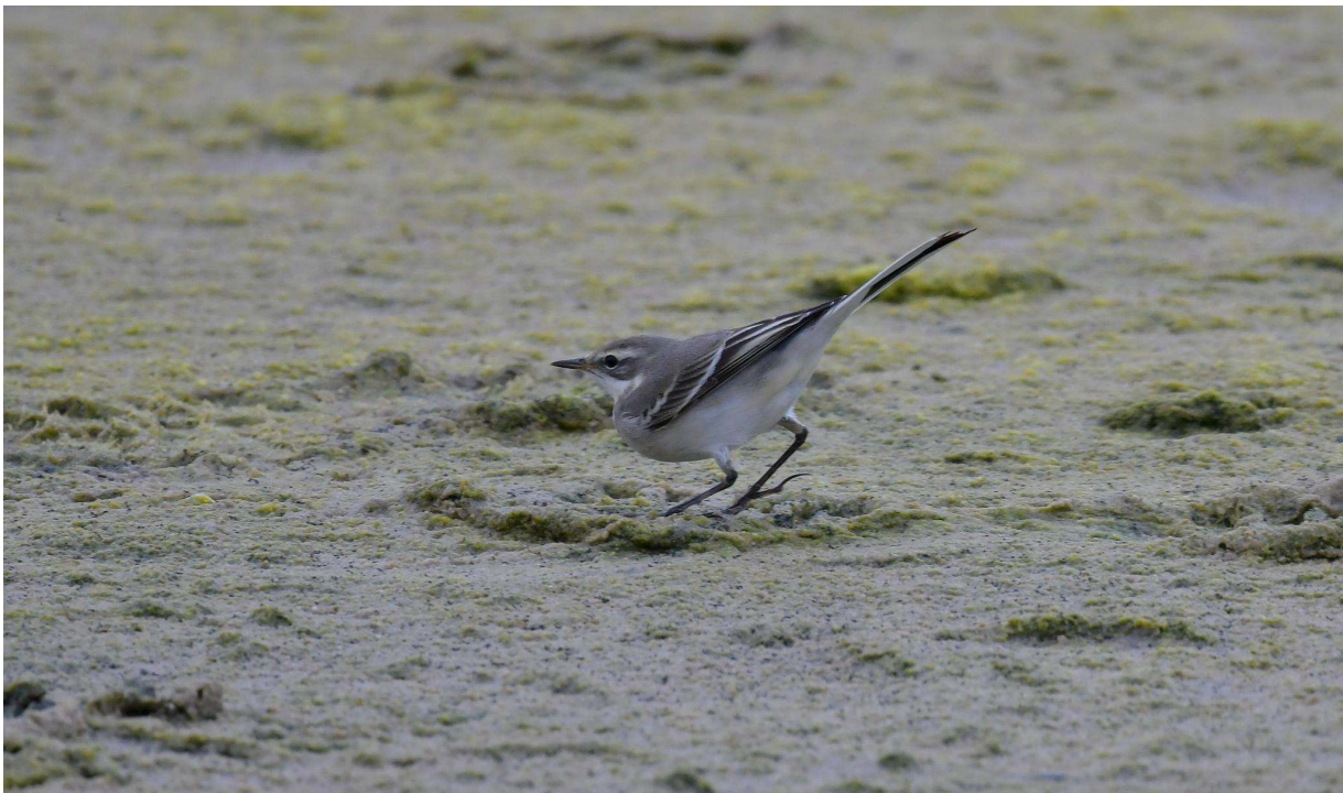
Østlig Gul Vipstjert, 29/9 2023, Grenen, Skagen, Danmark.

At fundet godkendes til art uden angivelse af underart alene ud fra stemmeoptagelser og dragtkarakterer harmonerer desuden med flere af vore nabolandes aktuelle tilgang til artsparret.